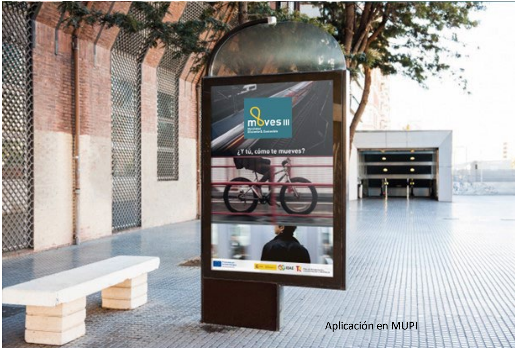
Aplicación en MUPI